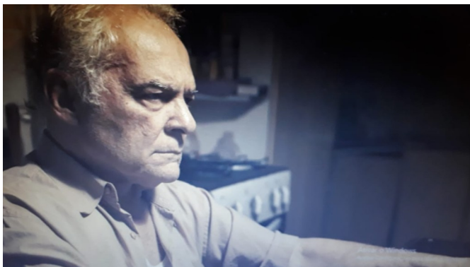
Imagem 4: Othon Bastos em cena de O último cine drive-in (2015)