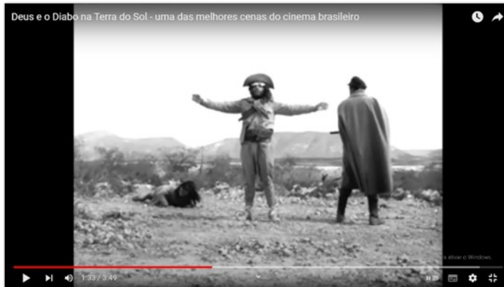
Imagem 5: Othon Bastos em cena de Deus e o Diabo na Terra do Sol (1964)