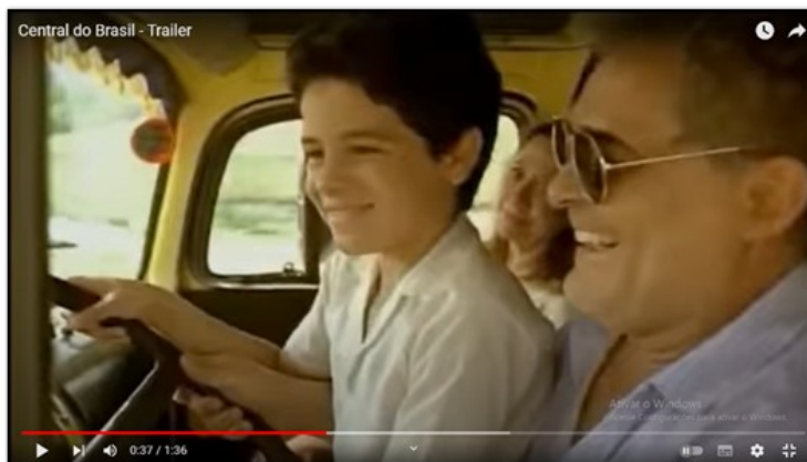
Imagem 1: Vinícius de Oliveira, Fernanda Montenegro e Othon Bastos em cena de Central do Brasil (1998)

Ao longo da viagem, em busca do pai do menino, Dora e Josué conhecem o caminhoneiro César (Othon Bastos), que lhes oferece carona e desperta interesse romântico em Dora. Na imagem 1, abaixo, está a cena em que Dora revela que o sonho de Josué era ser caminhoneiro e pede que César deixe o menino dirigir um pouco. Dessa forma, há a construção de um momento alegre no filme. De certo modo, pode-se pensar nesse momento como a constituição de um núcleo familiar. O efeito melodramático aparece nos rostos sorridentes, na escolha da luz e na trilha sonora que sucede a cena, com o caminhão indo embora. Esses elementos criam uma conexão entre o espectador e o filme, conferindo à estética do filme, uma significação ideológica e, ao mesmo tempo, moral, pois se constitui como uma narrativa redentora, capaz de comover o espectador, aproximando-se mais do melodrama que de uma representação realista.