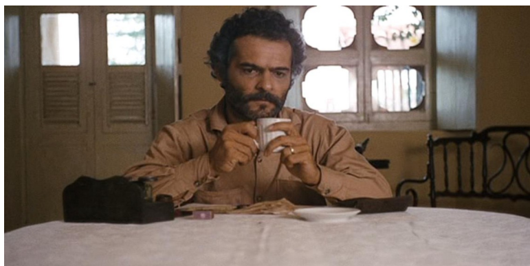
Imagem 3: Othon Bastos em cena de São Bernardo (1971)

O diretor de fotografia destaca a escassez de recursos e a consequente implicação disso na forma do filme, marcada pelo uso da iluminação natural, de câmera fixa e de planos longos. Essa opção estética vinculada à realidade enfrentada na produção cinematográfica confere realismo a S. Bernardo e podem ser notadas também em O último cine drive-in : há algumas cenas com câmera fixa, principalmente, as relacionadas ao hospital, de modo a criar uma atmosfera realista que indica crítica ao sistema público de saúde. Essa questão da esfera pública é notada, ainda, no trâmite político que objetiva fechar o cine drive-in e vale ressaltar que o filme é ambientado em Brasília, capital do país, o que indica crítica direta à condução política do Brasil.